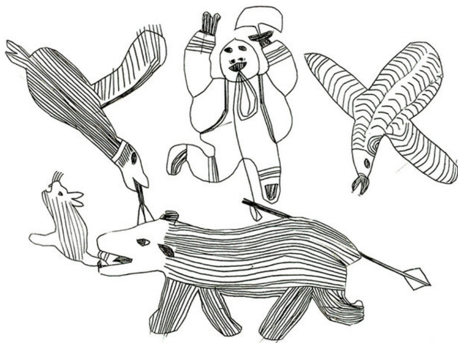
* Žena s nožíkom_1963