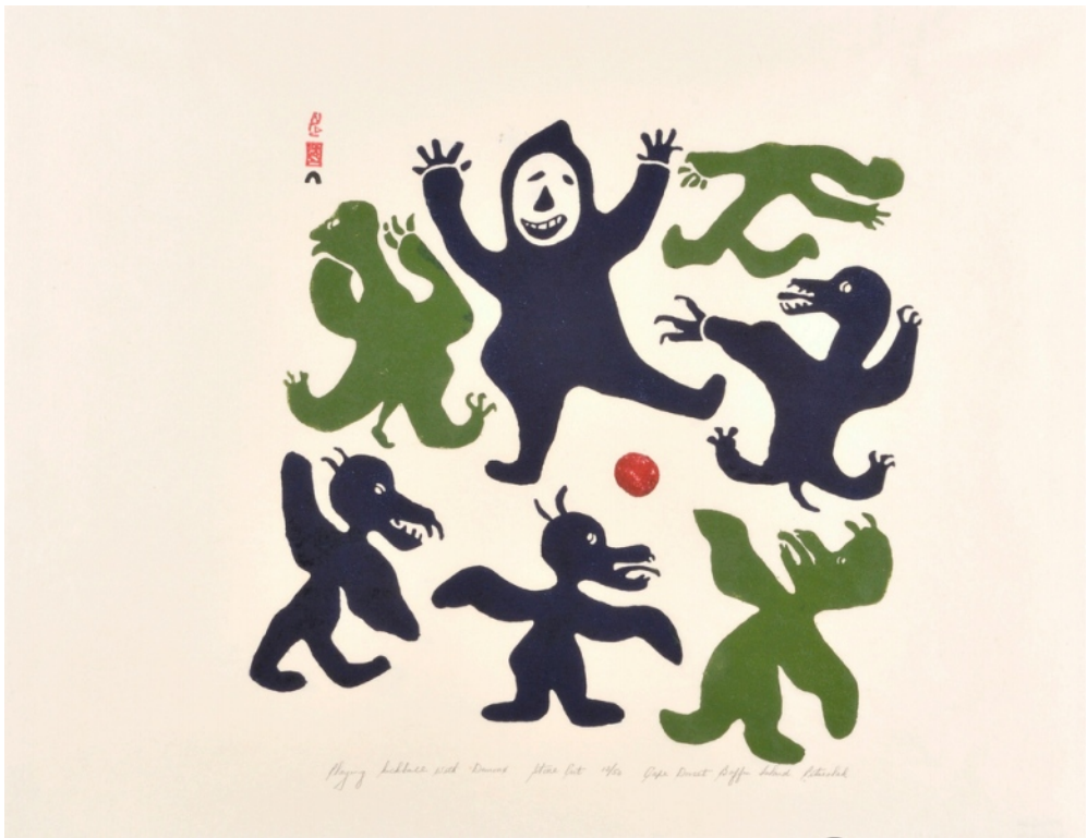
* Démoni si kopú loptu _1960