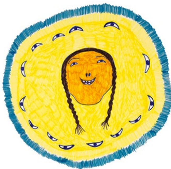
* Oči šťastnej ženy_1974